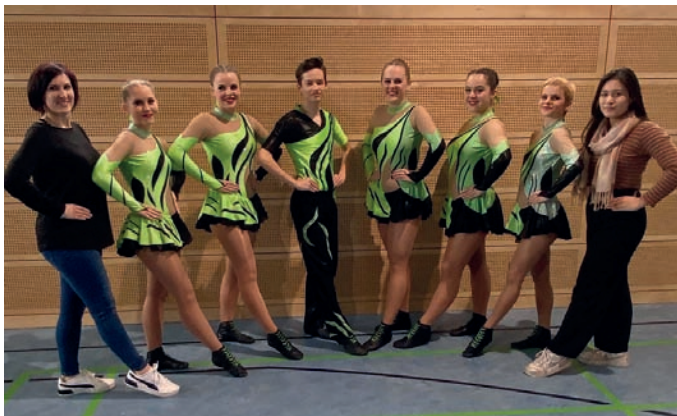
Die erfolgreiche Hauptklassenformation „Toros“

Der Markt Kleinwallstadt gratuliert ganz herzlich zu diesen herausragenden Erfolgen.