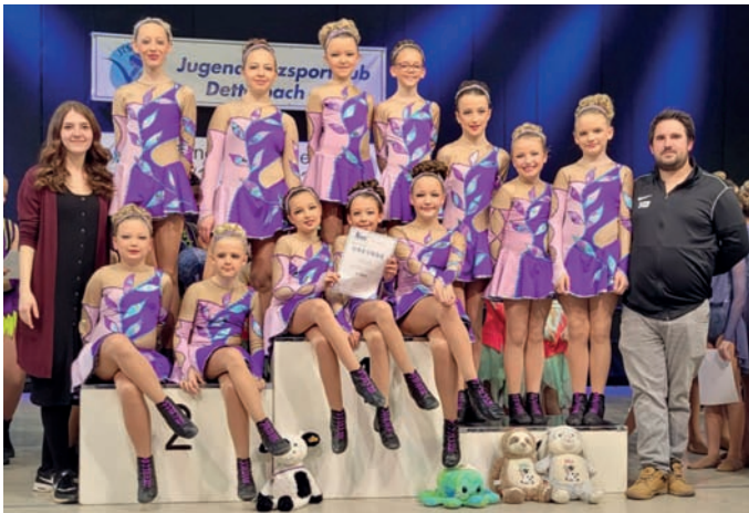
Die erfolgreiche Schülerformation „Little Toros“

Die Hauptklassenformation „Toros“ wurde in der Disziplin Haupt-Garde Small Group Bayerischer Vizemeister und Deutscher Vizemeister . Außerdem konnte die Gruppe in der gleichen Disziplin bei der Europameisterschaft den 4. Platz belegen.