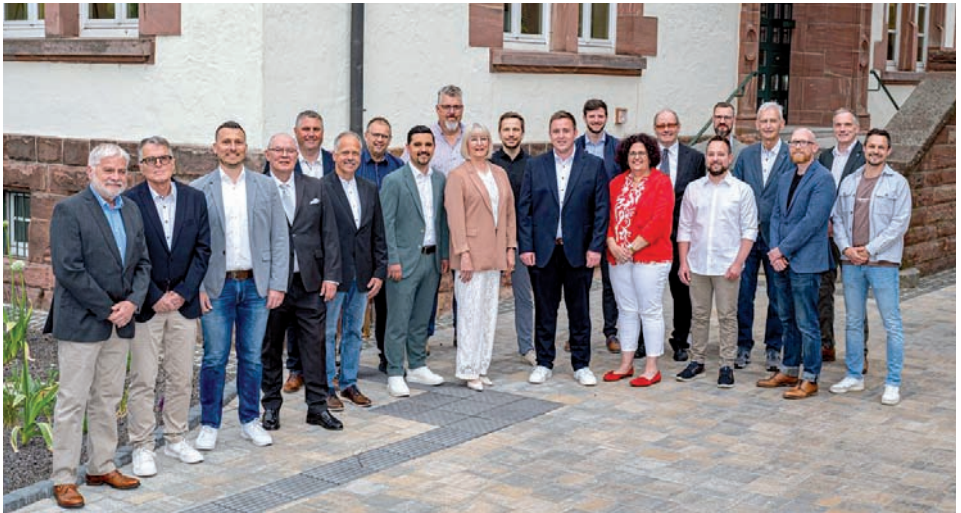
Das Foto zeigt den neuen Marktgemeinderat Kleinwallstadt für die Amtszeit 2026 - 2032