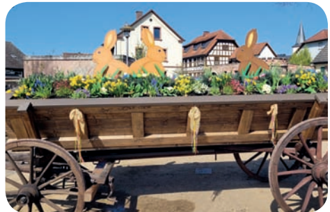
Am Roten Kreuz